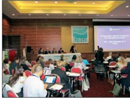
7. európske regionálne zasadnutie Ramsarského dohovoru

vodou podmienených ekosystémov v najbližších rokoch. Účastníci zhodnotili pokrok pri napĺňaní Dohovoru o mokradiach, venovali sa oblastiam spoločného záujmu pri implementácii dohovoru, ako aj navrhovaným rezolúciám a dokumentom pripravovaným pre 11. zasadnutie konferencie zmluvných strán. Dôraz sa kládol na inovatívne a trvalo udržateľné prístupy, využívanie týchto mokradí ako nástroja pri plánovaní manažmentu vôd v povodí a spôsobom účinného podania problematiky verejnosti. Na podujatí spolupracovala Štátna ochrana prírody SR so sekretariátom Ramsarského dohovoru, s Ministerstvom životného prostredia SR, Ministerstvom dopravy, výstavby a regionálneho rozvoja SR, Slovenskou agentúrou pre cestovný ruch, Ministerstvom zahraničných vecí SR, Daphne - Inštitútom aplikovanej ekológie, WWF Rakúsko, Karpatskou iniciatívou pre mokrade a s primátormi Trnavy a Skalice. Aj vďaka ich pozitívnemu prístupu a úsiliu sa podarilo prezentovať Slovensko a región ako časť Európy s výraznou snahou o zachovanie mokradí, plnenie cieľov Ramsarského dohovoru i smerníc EÚ na ochranu biodiverzity a podporu cezhraničnej spolupráce.