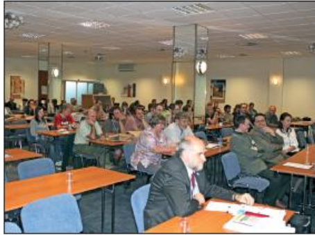
Seminár Mokrade pre budúcnosť