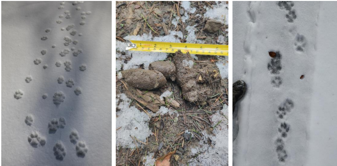
Pobytové znaky vlka dravého

- závažným problémom je zásah do sociálnej štruktúry vlčích rodín vplyvom poľovníctva, čo má svoje často pozorovateľné negatívne následky, napr. zvýšený predačný tlak smerovaný na hospodárske zvieratá