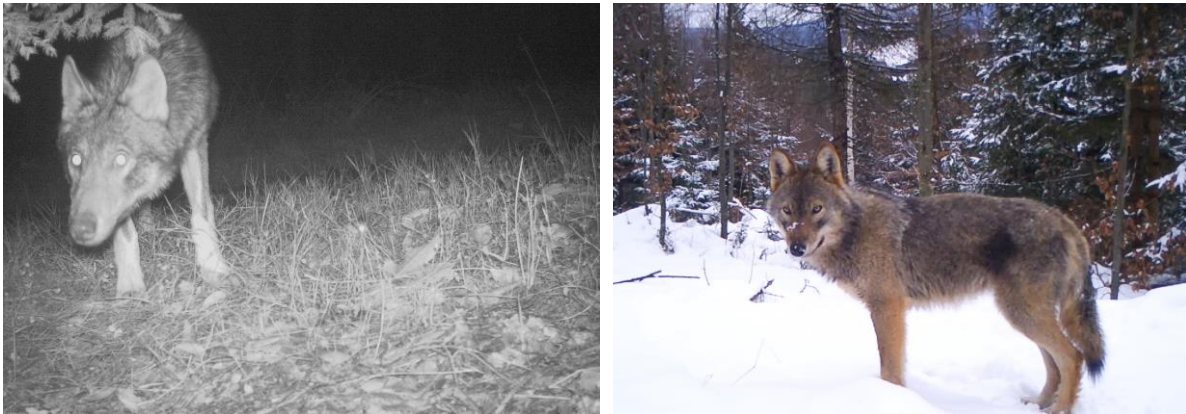
Zábery z fotopascí - vlk dravý

Z celkového zisteného počtu 26 jedincov vlka dravého boli či už priamo v teréne, alebo pomocou fotopascí zdokumentované celkovo 4 poranené/krívajúce jedince. Vlk dravý žije v celku „dobrodružným“ životom s čím práve môžu súvisieť tieto zranenia. Samozrejme, treba rátať aj s ľudským faktorom, ktorý má určite významný vplyv na vznik podobných zranení a nielen u vlka: legálny lov, pytliactvo a kolízie na dopravných komunikáciách.