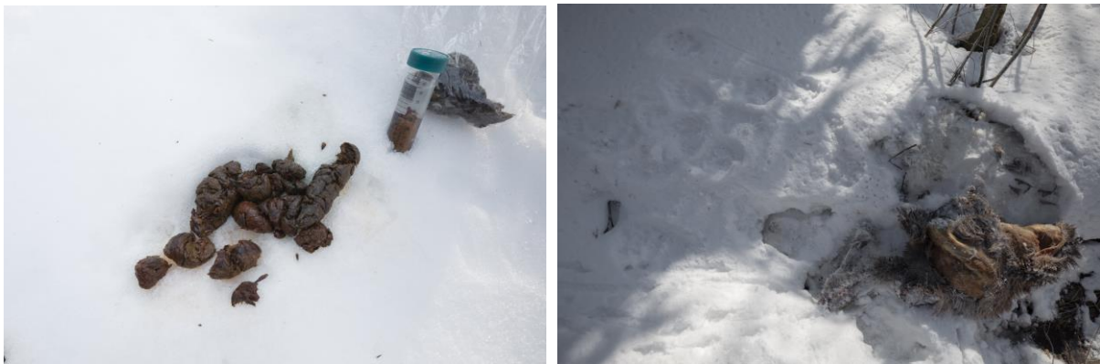
Vľavo trus medveďa hnedého, vpravo korisť vlkov (kleptoparazitizmus medveďa hnedého)

Celkovo bolo počas monitoringu zaznamenaných 68 čerstvých stopových dráh veľkých šeliem (brali sa do úvahy iba stopové dráhy staré do 24 hod.) z toho 31 rysích, 37 vlčích. V priebehu monitoringu bola lokalizovaná len jedna cca 3 dni stará stopová dráha medveďa hnedého na dvoch transektoch. Odobraných bolo celkovo 13 vzoriek trusu na DNA a potravnú analýzu vlka, rysa a medveďa.