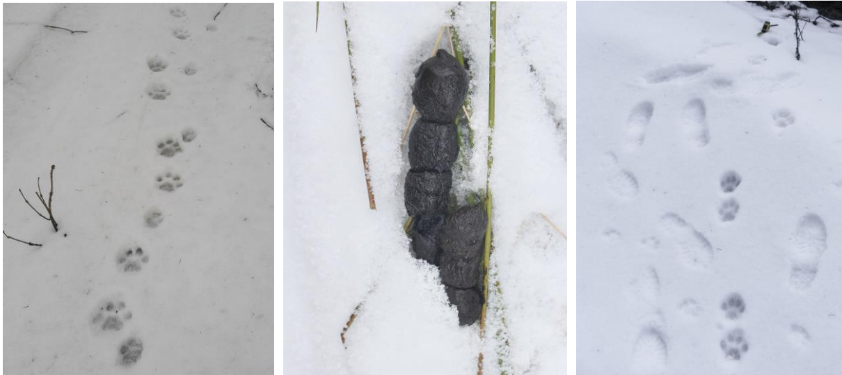
Pobytové znaky rysa ostrovida

Zaujímavá je opätovná hibernácia medveďa hnedého v Javorníkoch. V tomto orografickom celku je jeho výskyt v porovnaní s Kysuckými Beskydmi a Kysuckou vrchovinou vzácnosťou. Ochrana celoročne chráneného medveďa hnedého v Javorníkoch s presahom na Moravu je súčasťou medzinárodnej spolupráce medzi SR a ČR.