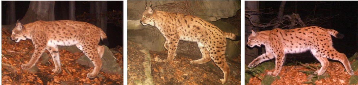
Zábery z fotopascí rys ostrovid (Ondrinka, Martin a Žigmund)